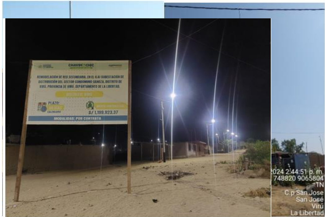
FOTO N° 03: PRUEBAS Y PUESTA EN SERVICIO, OPERATIVIDAD DE Y ACOMETIDAS ALUMBRADO PÚBLICO.