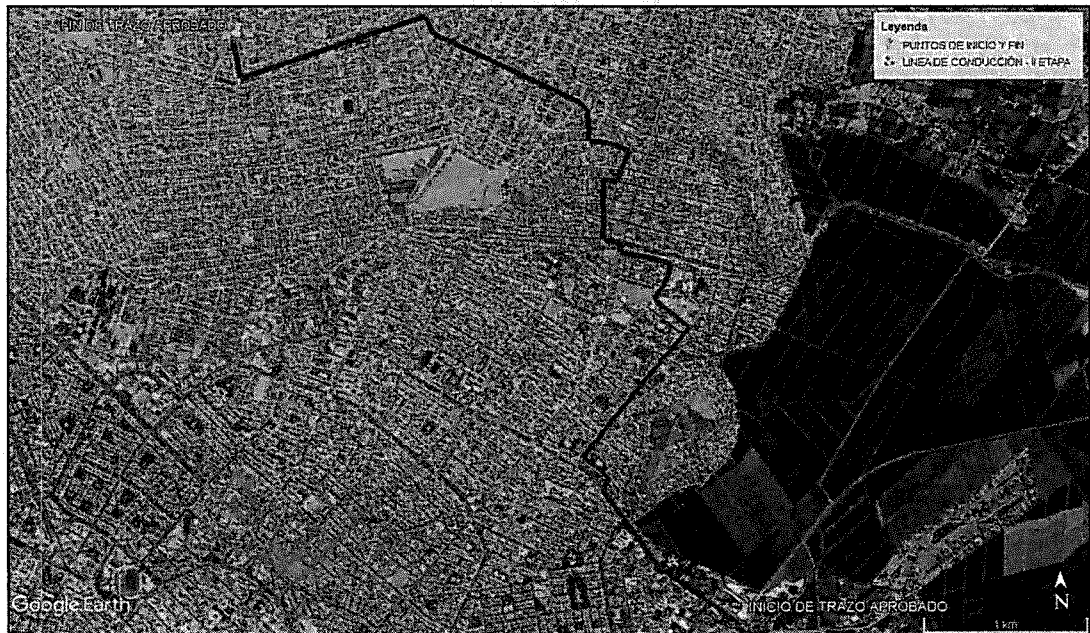
IMAGEN N° 04: Ubicación del área a intervenir

Firmado digitalmente por SANDOVAL CARRANZA Abigail Sara FAU 20440374248 soft Motivo: Doy V° B° Fecha: 30.05.2024 16:29:31 -05:00